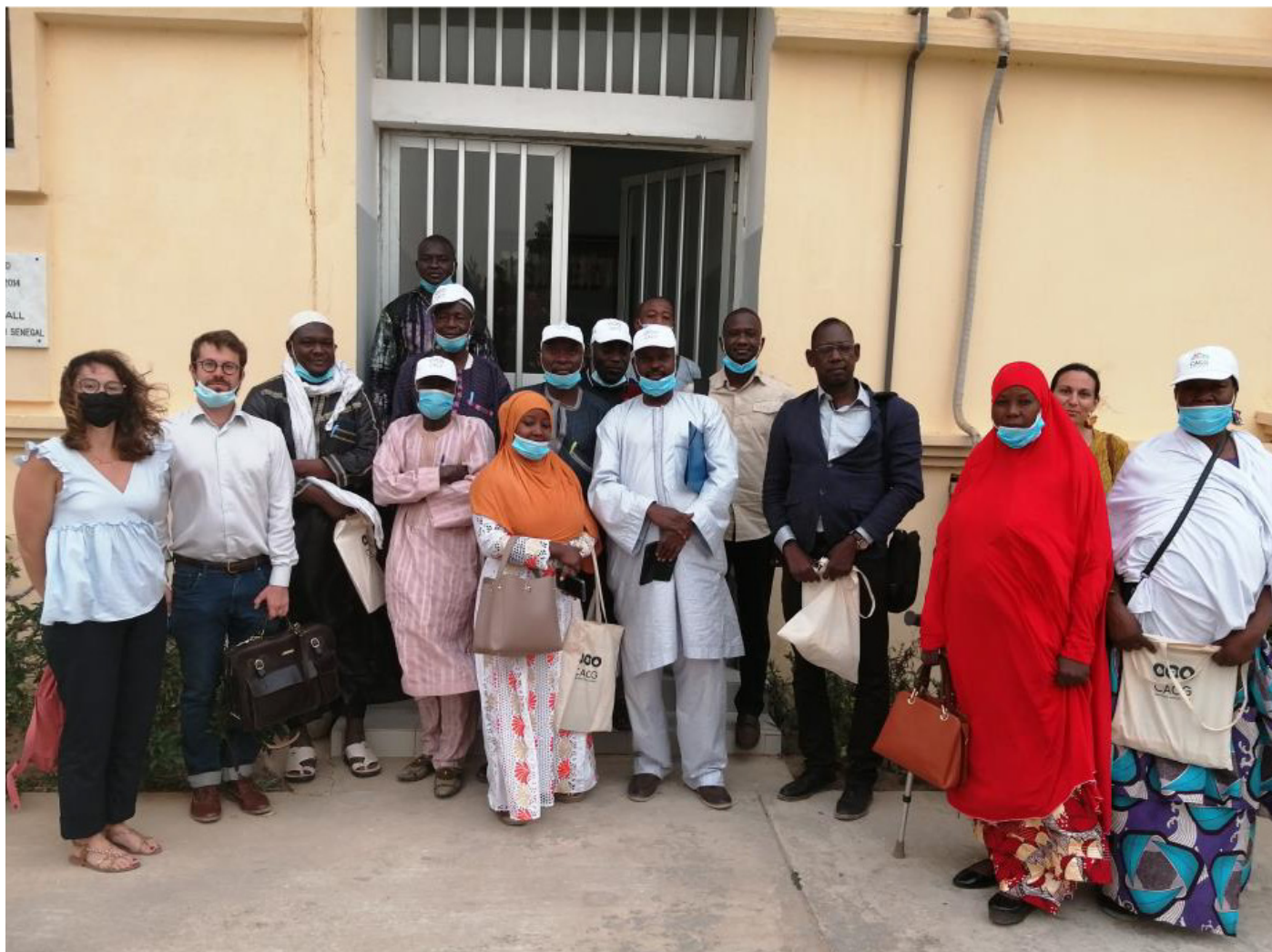
Rencontre avec la SAED.

Dans le cadre de la mise en œuvre de la sous activité Gestion Durable du Système d'Irrigation, des représentants de l'Association des Usagers d'Eau Irrigation de Konni (AUEI) et MCA-Niger se sont rendus au Sénégal en vue d'échanger avec des Unions hydrauliques de ce pays.