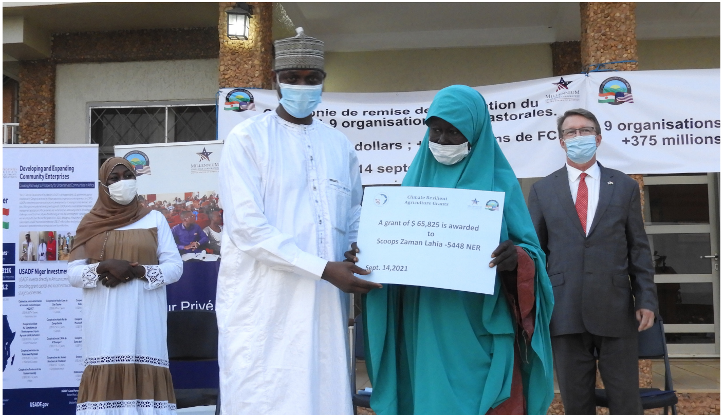
Une des bénéficiaires reçoit son chèque du DG de MCA-Niger.

Cette rencontre tenue à la résidence de l'Ambassadeur des Etats-Unis au Niger le 14 septembre 2021 a connu son apothéose avec la remise de subventions à neuf organisations agropastorales au terme d'un appel à propositions.