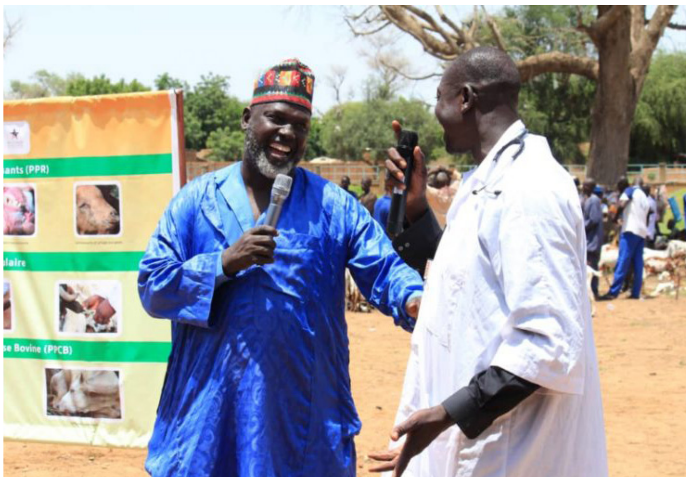
Le théâtre comme moyen de sensibilisation.

Après les étapes de Tillabéry, Say, Balleyara, la caravane s'est poursuivie à Torodi.