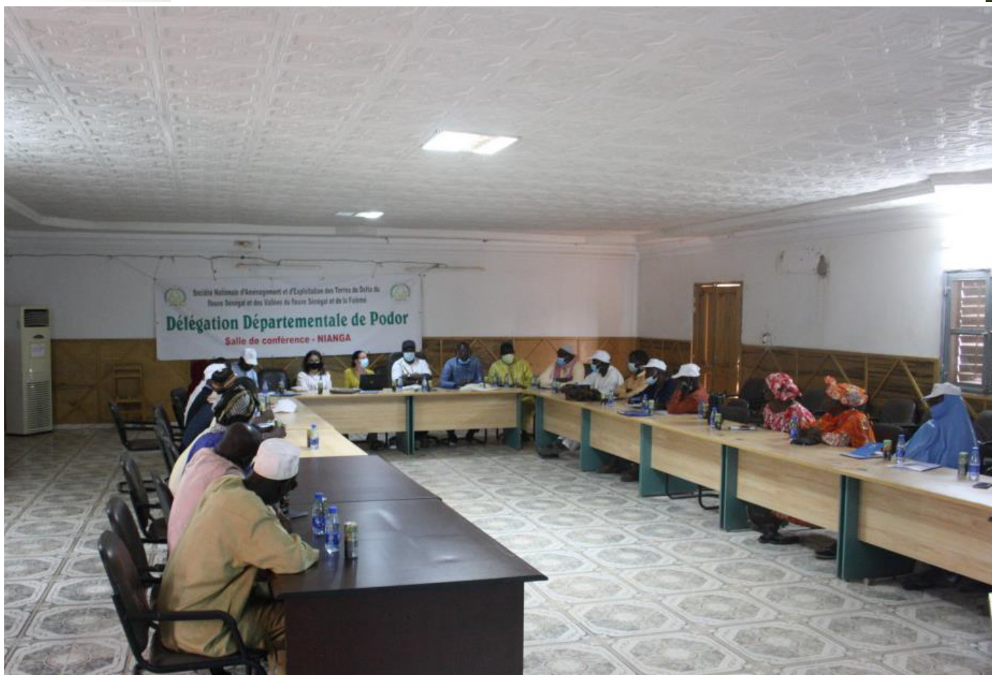
Echanges à la Délégation de Podor.

Une rencontre avec celle-ci et une visite de plusieurs unions d'irrigants ont été organisées. Les participants se sont rendus notamment dans les régions de Podor et Saint Louis. Ils ont également eu une séance de travail avec le Centre de Gestion et d'Economie Rurale de la vallée du fleuve Sénégal (CGER Vallée), un acteur clé dans le processus d'autonomisation et de professionnalisation des associations d'irrigants