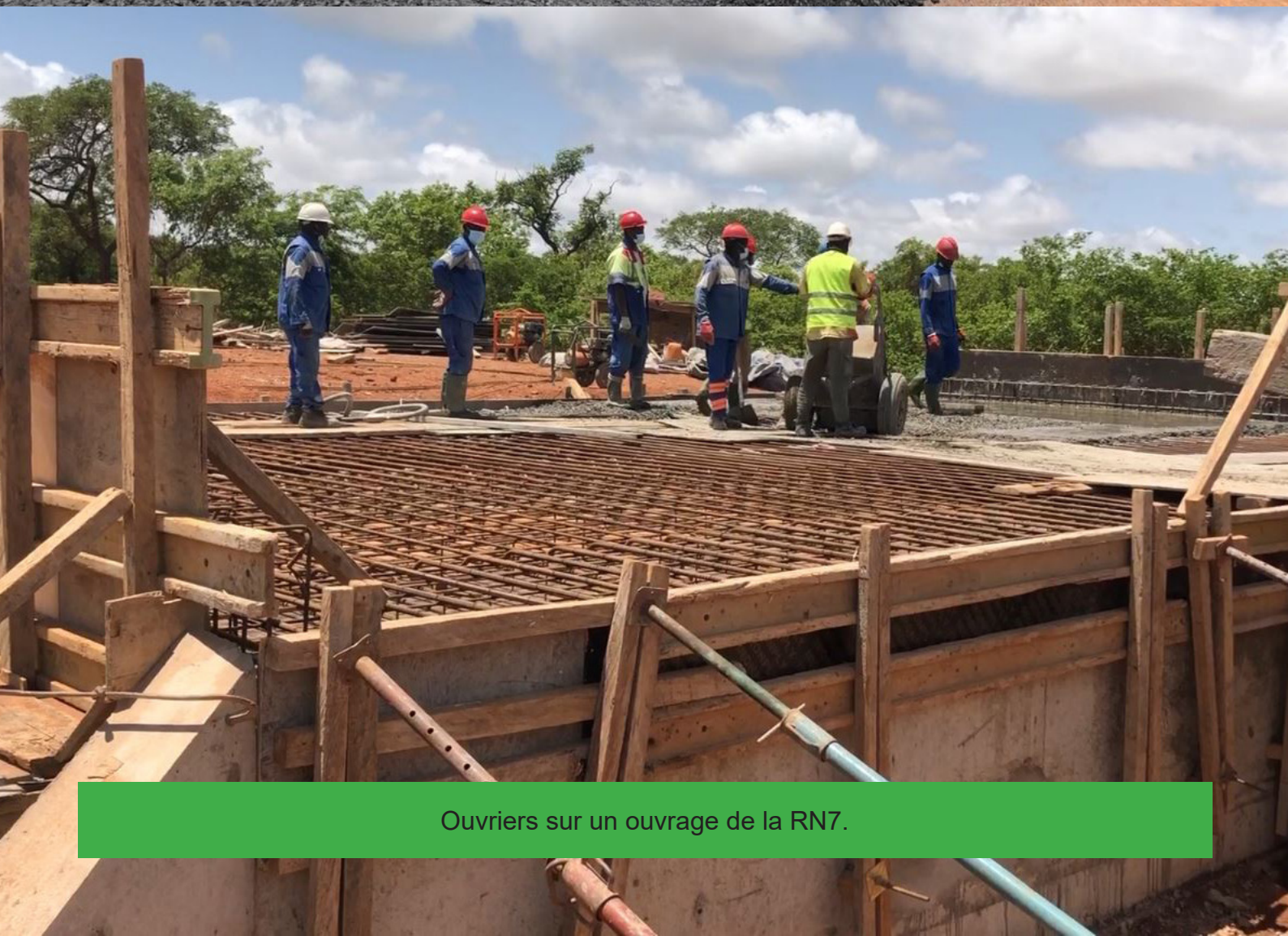
Ouvriers sur un ouvrage de la RN7.