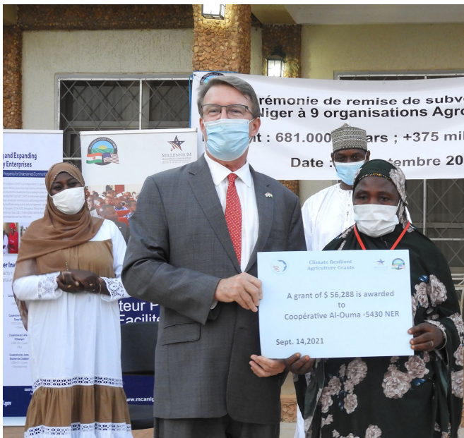
L'Ambassadeur des USA remet le chèque à une récipiendaire.

La Facilité de subventions de l'activité Agriculture Résiliente au Climat propose à travers des subventions, de fournir des services de développement aux entreprises, d'accroître les investissements dans les actifs productifs et de permettre l'adoption des pratiques et techniques agricoles respectueuses de l'environnement.