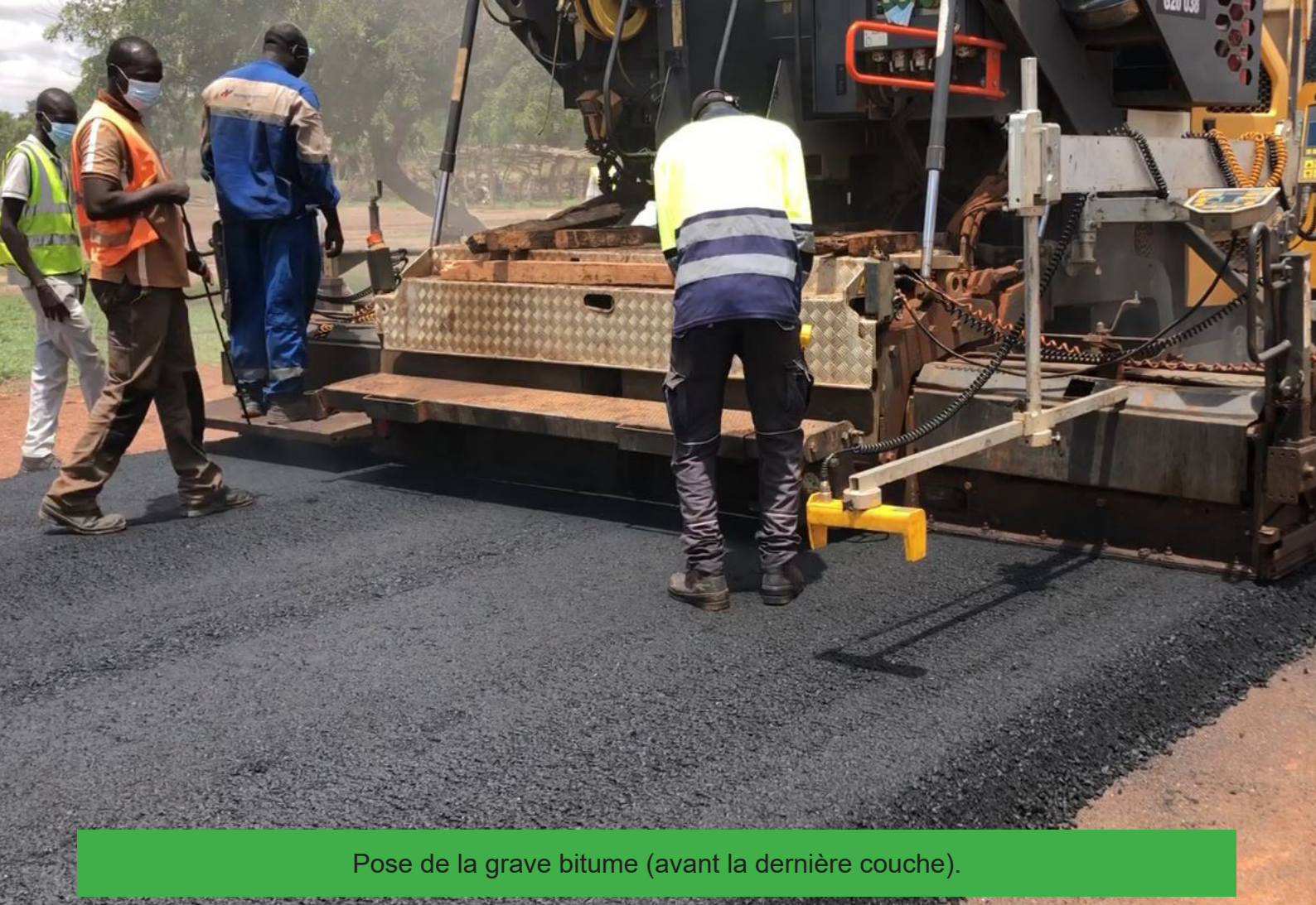
Pose de la grave bitume (avant la dernière couche).